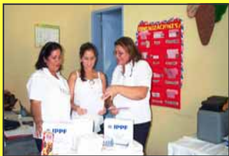
Proyecto iniciado con el apoyo de CEDNA-FEPNA, ejecutando talleres de sexualidad responsable y distribución de métodos anticonceptivos con varios Municipios del Estado: Sucre, Montes, Cruz Salmerón Acosta, Ribero, Bolívar y Mejía.