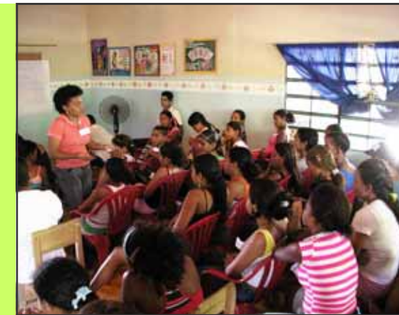
La base de nuestras actividades rurales se ubica en el valle de Río Brito, una zona que forma parte de la cuenca del Río Manzanares en la vía Cumaná-Cumanacoa. En la fotografía se dicta un taller sobre salud sexual y reproductiva, en el área rural.

La Fundación ServYr es una organización venezolana sin fines de lucro, cuyo objetivo general es brindar atención integral a la población de bajos recursos económicos del Estado Sucre con el fin de elevar su nivel de vida.