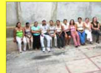
Grupo de Araya esperando ser evaluadas para planificación familiar.