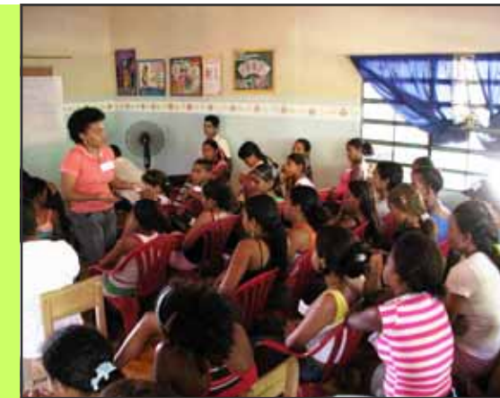
La base de nuestras actividades rurales se ubica en el valle de Río Brito, una zona que forma parte de la cuenca del Río Manzanares en la vía Cumaná-Cumanacoa. En la fotografía se dicta un taller sobre salud sexual y reproductiva, en el área rural.

La Fundación ServYr es una organización venezolana sin fines de lucro, cuyo objetivo general es brindar atención integral a la población de bajos recursos económicos del Estado Sucre con el fin de elevar su nivel de vida.