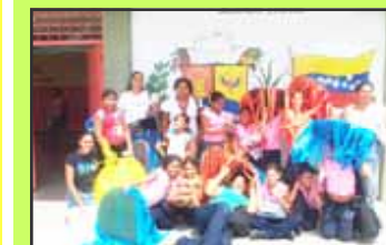
Un proyecto realizado con el apoyo económico de la Gobernación del Estado Sucre desde el año 2007. Se ejecutan actividades

con atención al niño, adolescente y familias en general de las comunidades rurales de Carretera Cumaná-Cumanacoa.