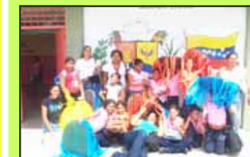
Un proyecto realizado con el apoyo económico de la Gobernación del Estado Sucre desde el año 2007. Se ejecutan actividades

con atención al niño, adolescente y familias en general de las comunidades rurales de Carretera Cumaná-Cumanacoa.