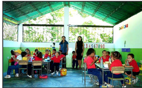
Estudiantes y maestros en el preescolar.