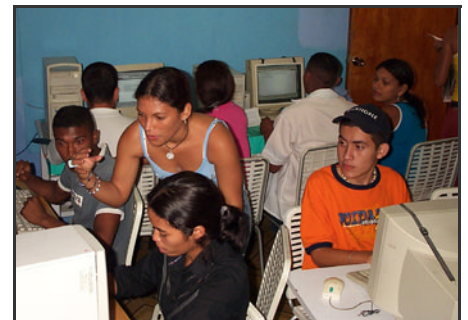
Jovenes asistiendo en una clase de computación en la Casa ServYr.

En Mayo de 2003, conseguimos una casa donde se ubica nuestra sede. Aquí hemos puesto un Centro de Computación donde los jóvenes resuelven actividades escolares, y ofrecemos cursos y apoyo en computación. Planificamos otros proyectos en salud y educación para la población juvenil y ubicar nuestra oficina principal.