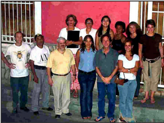
Miembros de la Junta Directiva de la Fundación ServYr en frente de la Casa ServYr.